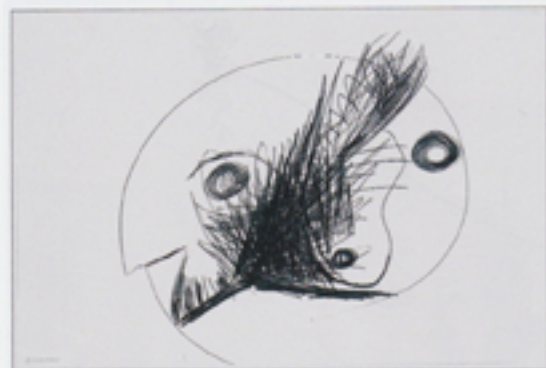
EVA & ADELE, Obsidian 2012, Graphit auf Zeichenpapier, 34 x 50 cm