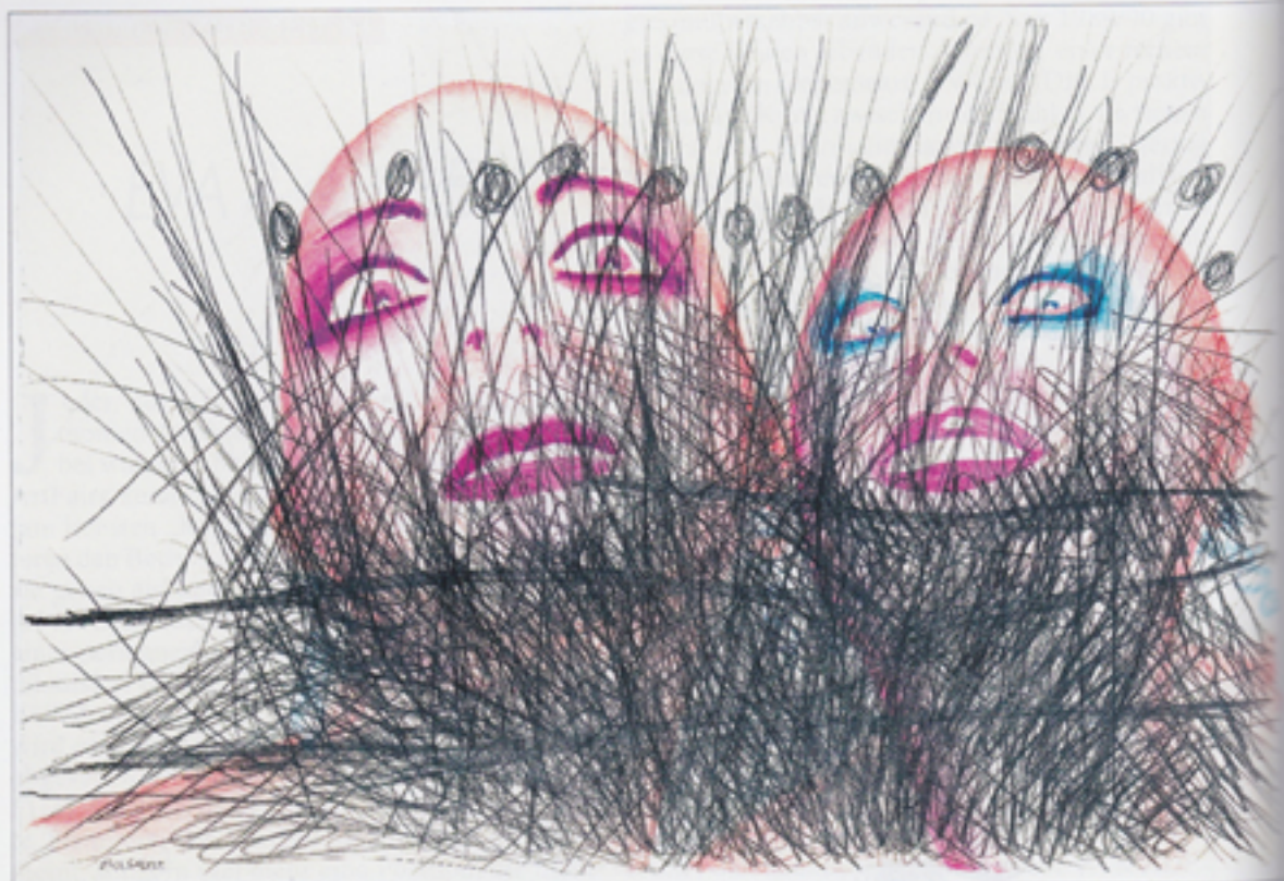
EVA & ADELE, Tides 2012, Aquarell, Graphit auf Büttlen 38 x 56 cm